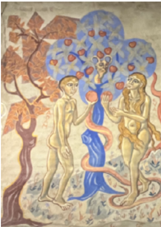
Extrait des Fresques de l'église Sainte Anne à Chatel-Guyon (Auvergne) par Nicolai Greschni